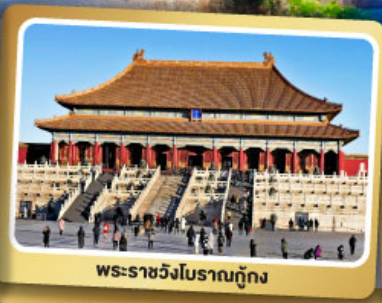
พระราชวังโบราณกู้กง