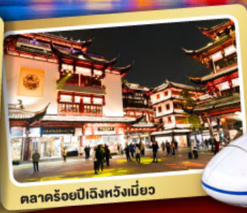
ตลาดร้อยปีเจิ้งหวิงเมี่ยว