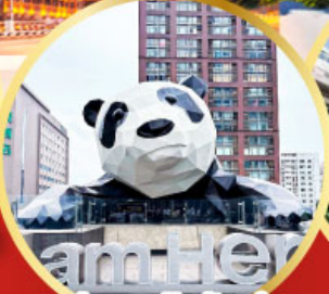
หมีแพนด้าป็นตึก