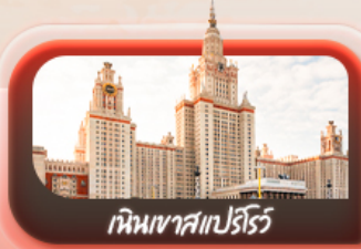
เนินเขาสเปร์ไร