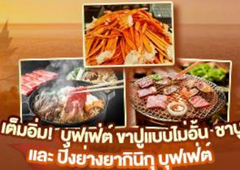
เค็มอิม่า บุฟเฟ่ต์ ซาปูแบบโมอิน ซาปู และ บิงย่างยากินิคุ บุฟเฟ่ต์

สัมผัสความเป็นญี่ปุ่น ชมวิวฟูจิ ครบทุกไฮไลท์เด่นๆ ห้ามพลาด ขึ้นดาตั้นใจกับหมู่บ้านมรดกโลกหมู่บ้านชิราคาวาโกะ ขึ้นกระเช้าลอยฟ้าชินโงทากะ ปั่นชมเมมเบ็น้องทวาง นารา ขอพรวัดโทไดจิ เช็กอินปราสาทโอซาก้า วัดคิโยมิต्सึดะระ ถ่ายรูปทำซูมิมือสุดฮิต ป้ายกุกิลิเกะ ปราสาทมัตสึโมโด้ ทะเลสาบชูวะ ขึ้นชมศาลเจ้าฟูจิซังเซเมงเงน หมู่บ้านน้ำใสโฮชิโนะฮักโก ปิดท้ายช้อปปิ้งย่านดัง ชินจูกุ