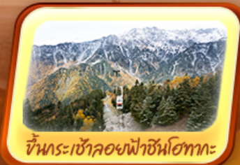
ขึ้นกระเช้าลอยฟ้าชินโงทากะ