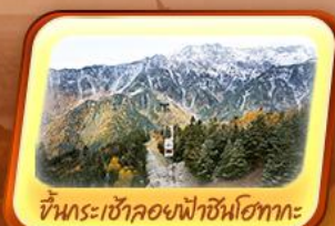
ขึ้นกระเช้าลอยฟ้าชินโงทากะ