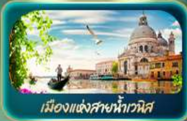
เมืองแห่งสายน้ำเวนิส

จุดบรรจบความอลังการของธรรมชาติ Dolomites และ ทะเลสาบมิซูรีน่า ซมน์น้ำสิเทอร์ควอยซ์ ทะเลสาบเบริยส สูดโรแมนติกเมืองแห่งสายน้ำอวิส ห้าบพลาด มหาวิหารดูโอโมแห่งมิลาน โรบิน อาธิน่า บ้านของจูเลียต เที่ยวลูเซิร์น ชมสิงโตหินแกะสลัก เดินเล่นสะพานไม้ชาเปล อินส์บรุค ย้อนอดีตกับสาชเชนต์แอนน์ หลังคาทองคำ ช้อปปิ้ง Outlet