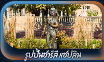
รูปปั้นชาร์ลี แชปลิน