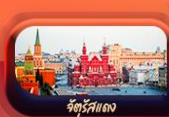
จัตุรัสแดง