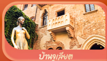
บ้านจูเลียต

Highlight เยือนหมู่บ้านแสนสวยเซอร์แมท เช็กอินศาลาไทยสุดงามที่โลซาน เที่ยวลูเซิร์น ชมสะพานไม้ชาเปลและอนุสาวรีย์สิงโต ซาลิ แชลปลิน ชมประติมากรรม The Fork และปราสาทซิลลองริมทะเลสาบ เยือนมิลาน มหาวิหารดูโอโม ที่เวนิส เมืองลอยน้ำสุดโรแมนติก อินกับรักอมตะที่บ้านจูเลียต และช้อปปิ้งจุใจที่ Serravalle Outlet