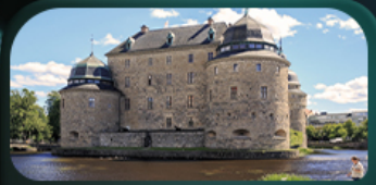
ปราสาทไอเรโบร