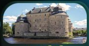
ปราสาทไอโรโบ

สต็อกโฮล์ม ไอโรโบ ออสโล ไอเดนเซ โคเปนเฮเกน