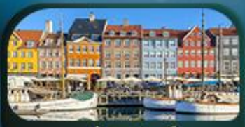
ย่านนูฮาวน์