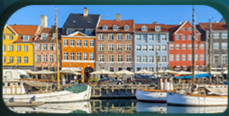
ย่านนูฮาวน์

Really want to see ... candinavia Sweden Norway Denmark