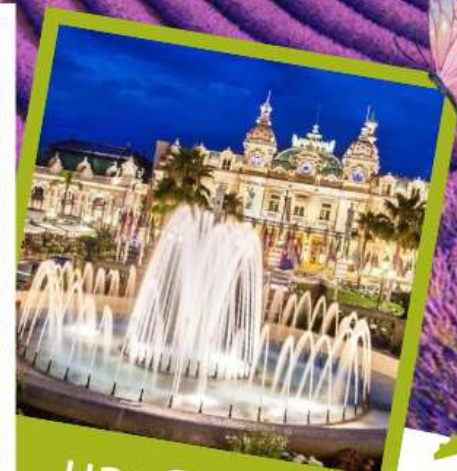
มอนติคาร์โร