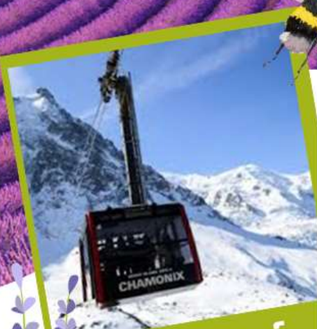
มองค้บลังค์