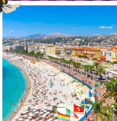
เฟรนช์ริเวียร่า