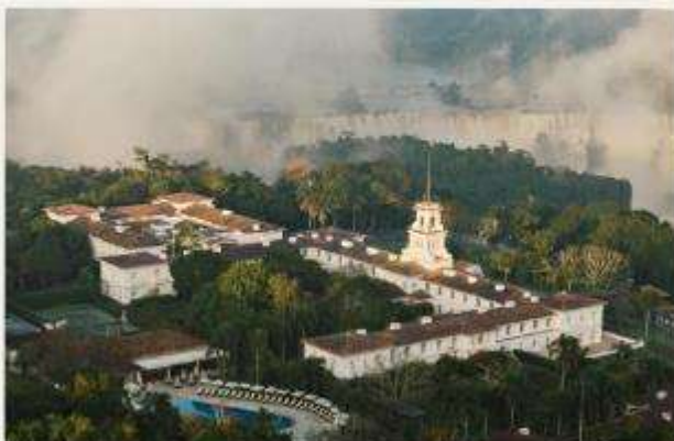
Hotel das Cataratas, A Belmond Hotel