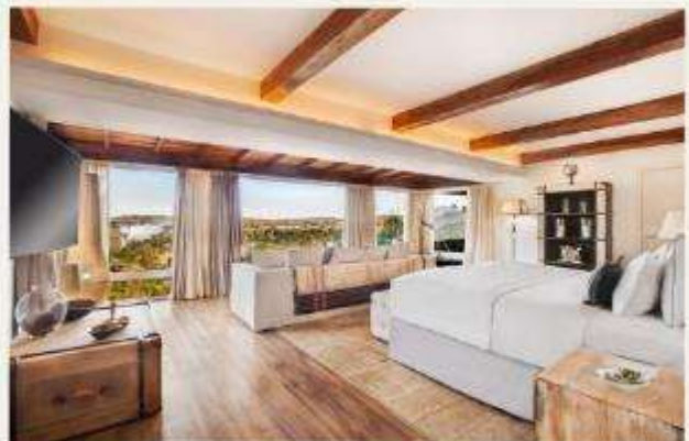
Gran Meliá Iguazú Argentina Side