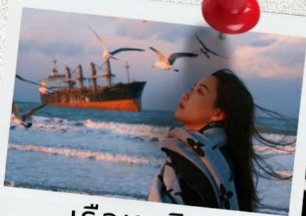
เรือบลูวิส