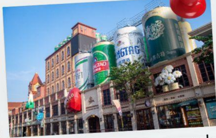
พิพิธภัณฑ์เบียร์ซิงเต่า