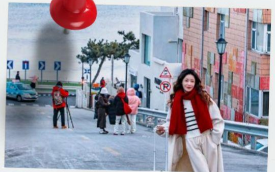
ถนนฮั่วจวีปา