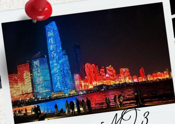
หาดไซเบอร์ MO.3