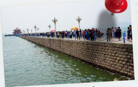
สะพานจ้านเจียว