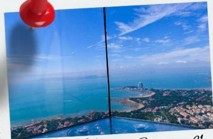
Qingdao Haitian Center ชั้น 81