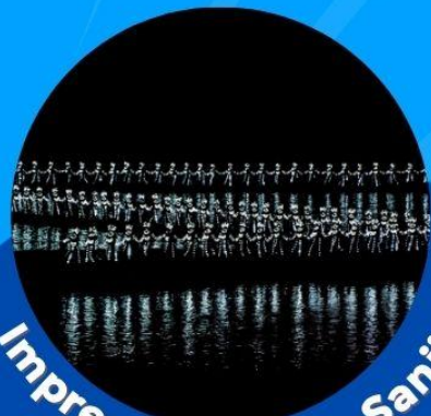
Impression of Liu Sanjie