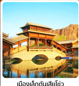
เมืองเล็กต้นเสี่ยโซ่ว