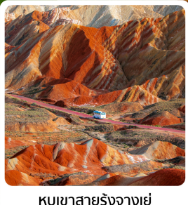
ภูเขาสายรุ้งจากเข้