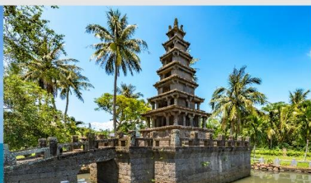
เจดีย์ 2 ชั้นนั่งเหม่ยหลาง