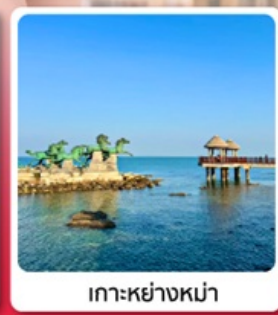
เกาะหย่างหม่า