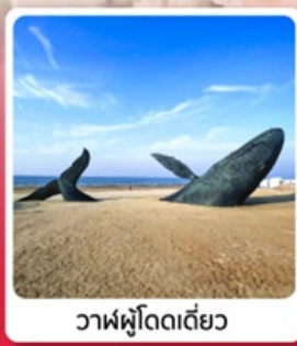
วาฬผู้โดดเดี่ยว