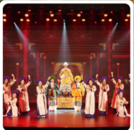
The Heritage Show

• โฮลท์ นัังกระเซ้าขึ้นยอดเขาบานาฮิลล์ ชมเมืองโบราณฮอยอัน สักการะเจ้าแม่กวนอิม