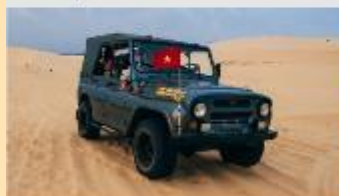
ทะเลทรายขาว