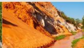
ลำธารนางฟ้า

*ทางบริษัทฯ ขอสงวนสิทธิ์ในการสลับโปรแกรมทัวร์ตามความเหมาะสมขึ้นอยู่กับสถานการณ์ปัจจุบัน โดยคำนึงถึงผลประโยชน์ของลูกค้าเป็นสำคัญ