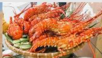
Nha Trang Night Market