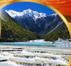
หุบเขาพระจันทร์ สีน้ำเงิน