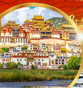
วัดชงจันหลิน