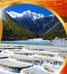
หุบเขาพระจันทร์ สีน้ำเงิน