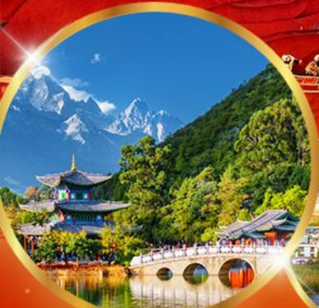
สระมิงกรี่ล่า