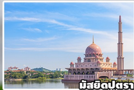
มัสยิดปุตรา