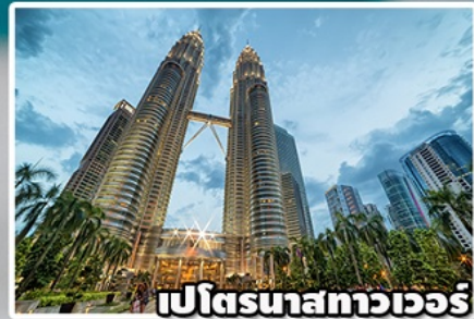
เปโตรนาสทาวเวอร์