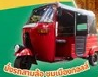
เมืองรัตนสิโหนะ ชมเมืองทอลล์

ท่าต้นนูลลา - พระพุทธไสยาสน์ - พิชิตยอดเขาสีทริยา ชมปราสาทลอยฟ้า ไชวีระป่าพื้นเมืองศรีลังกา - พระเขี้ยวแก้วเมืองแคนดี้ วัดศรีปรมาณูพระราชมหาวิหาร - ป้อมปราการเมืองทอลล์ เมืองรัตนสิโหนะ ชมเมืองทอลล์ - วัดกัลยาณี วัดคงคาราม - ซ้อมปิ้งย่างโอเตล