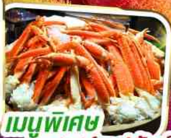
เมนูพิเศษ บุฟเฟ่ต์ขาปูยักษ์