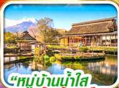
“หมู่บ้านน้ำใส โอชิโนะฮัทสึ”