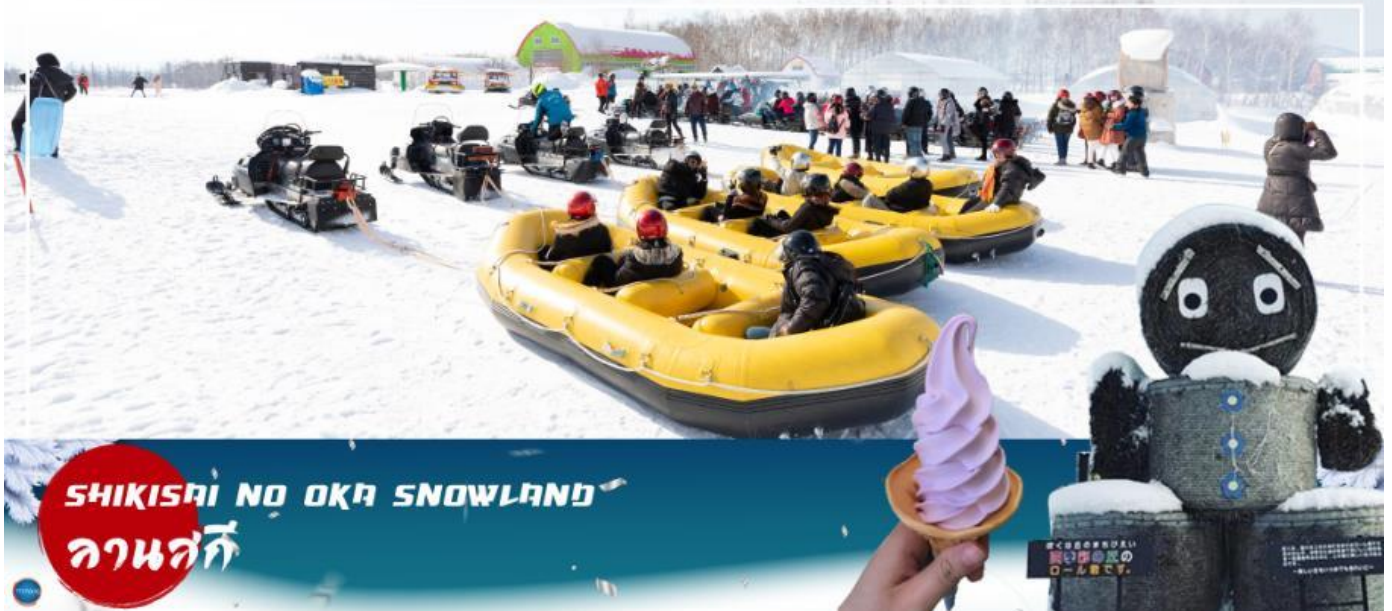
SHIKISAI NO OKA SNOWLAND ลานสกี

เมืองอาซาฮิคาว่า – เมืองฟูราโน – ลานสโนว์ เวิลด์ (กิจกรรมทางหิมะ) – หมู่บ้านเพนนิยาย นิงเกิ้ลเทอเรส – เมืองซัปโปโร – ถนนช้อปปิ้งทานุกิโคจิ