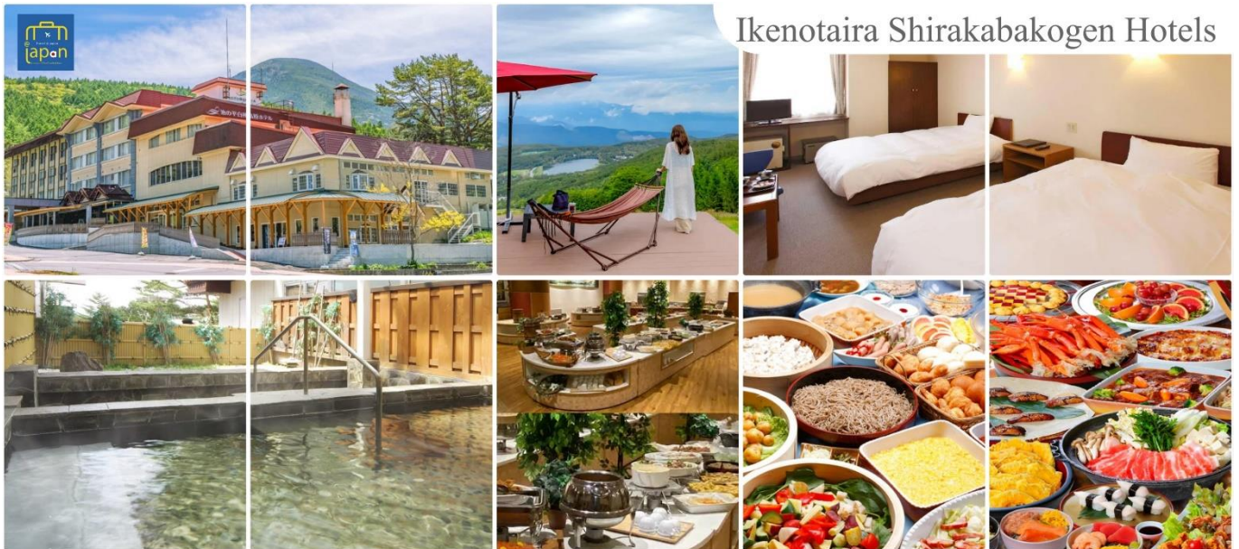
Ikenotaira Shirakabakogen Hotels

หลังอาหารให้ท่านได้ผ่อนคลายกับการแช่น้ำแร่ธรรมชาติ เชื่อว่าถ้าได้แช่น้ำแร่แล้ว จะทำให้ ผิวพรรณสวยงามและช่วยให้ระบบหมุนเวียนโลหิตดีขึ้น