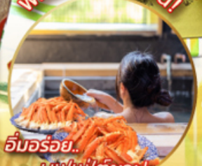
อิมมอร์รี่... บุฟเฟ่ต์ขาปู

ไฮไลท์!! ไฮไลท์ อลังการไฟล้านดวง ณ หมู่บ้านนาบะโนะ โนะ ซาโตะ สักการะพระใหญ่ ไดบุทสึ และชมเมืองกวาง เมืองนารา ชมวัดทองคินคะคุจิ เขื่อนวัดน้ำใสคิโยมิสึเดระ เล่นสกี ณ ฟุจิกั้นสกีรีสอร์ท ช้อปปิ้ง ย่านชินไซบาชิ และชินจูกุ ไม่พลาด!! บุฟเฟ่ต์ขาปูและเชื้อออนเซ็น