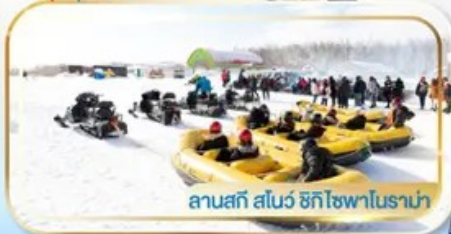
ลานสกี สโนว์ ฮักโซฟาโนราฆ่า