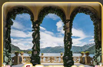
เชคอิน Villa del Balbianello

ที่สุดของธรรมชาติแห่งอิตาลี ทิวเขา ทะเลสาบ ความงามแห่งโดโลไมท์