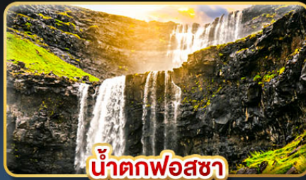
น้ำตกฟอสซา