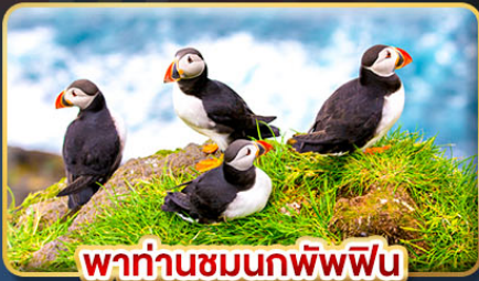
พาท่านชมนกพิพฟิน