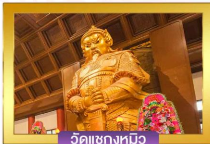
วัดแซงกหมิว