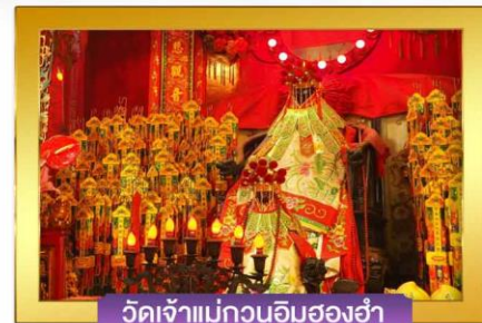
วัดเจ้าแม่กวนอิมฮ่องกง