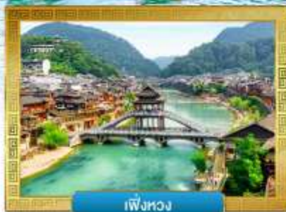
เฟิ่งหวง