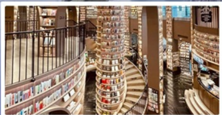
ร้านหนังสือจุงชู่เก๋อ