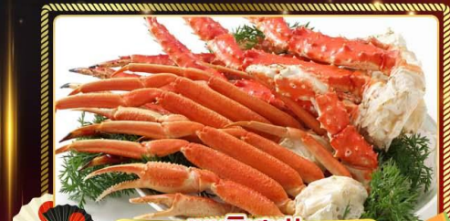
เมนูพิเศษ!! ซูชิปูตงกูปุซึกิ 3 ชนิด