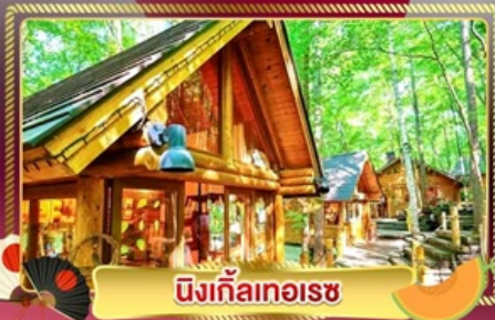
นิงเกิลทอเรซ

ชมทุ่งลาเวนเดอร์ และทุ่งดอกไม้ขึ้นชื่อของฮอกไกโด ฟาร์มโทมิตะ และ ชิโกะไซโนะโอะกะ