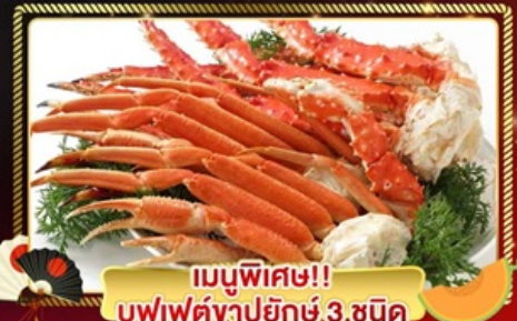
เมนูพิเศษ!! บุฟเฟ่ต์ขาปูยักษ์ 3 ชนิด