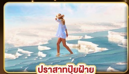
ปราสาทบูยีฝาย