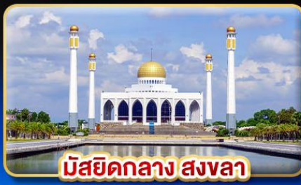
มัสยิดกลาง สงขลา