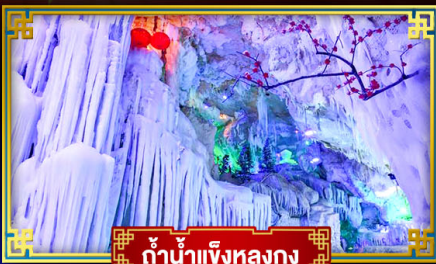
ถ้ำน้ำแข็งหลงกง

"เที่ยว 2 มณฑล กวางสี-กั๋วโจว" สุดอลังการ น้ำตก 2 พรมแดน แหล่งท่องเที่ยวระดับ 5A