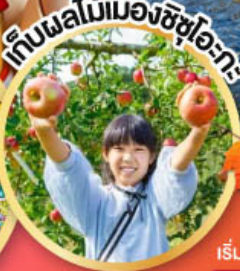
เก็บผลไม้เมืองชิซุโอะกะ