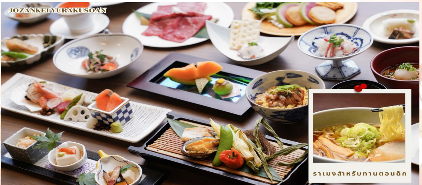
ราเม็งสำหรับทานตอนดึก

ค่า รับประทานอาหารค่ำ ณ ห้องอาหารของโรงแรม (มื้อที่ 5)