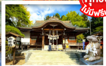
ศาลเจ้ายุคุระ(ศาลเจ้ากระต่าย)

พิเศษบุฟเฟ่ต์ชาบูสุดพรีเมียม ปูออกโทโด อาหารทะเล เนื้อวากิว สเต็ก ซูชิโอคุระ และเครื่องดื่มไม่อัน