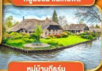
หมู่บ้านก็ธูร์น