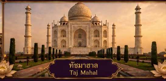
ทัชมาฮาล Taj Mahal