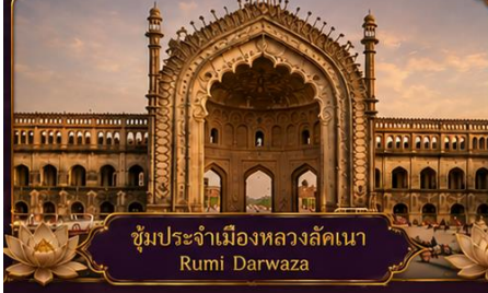
ซุ้มประจำเมืองหลวงลัคเนา Rumi Darwaza

พร้อมชมสิ่งมหัศจรรย์อินเดียในทริป 9 วัน 7 คืน