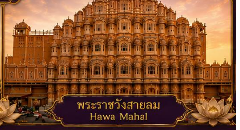
พระราชวังสายลม Hawa Mahal