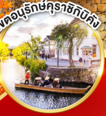
เขตอนุรักษ์คุราชิกิบิคัง