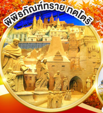
พิพิธภัณฑ์รายกตโตริ