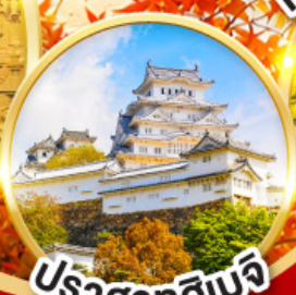
ปราสาทโอเมจิ