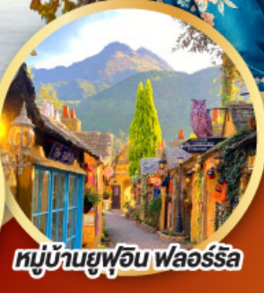
หมู่บ้านยูฟูอิน ฟลอร์ริล