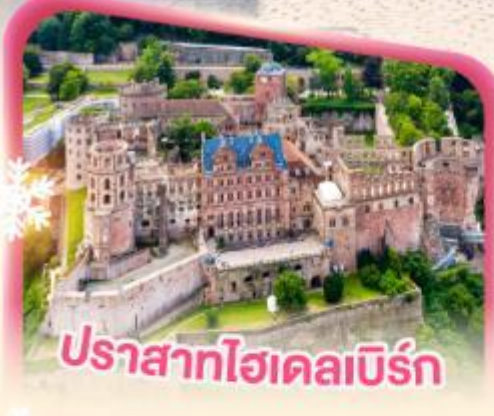
ปราสาทโฮเดลเบิร์ก