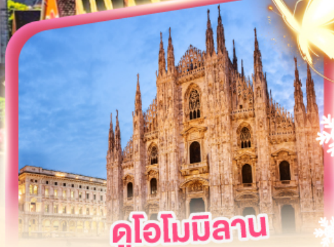
คูโอโมมิลาน