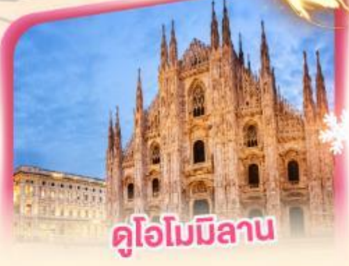
คูโอโมมิลาน