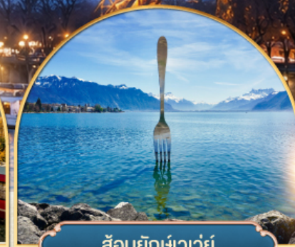
ล้อมยักซ์เวอว์