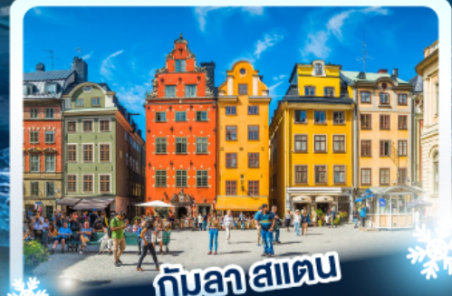
❄️ ❄️ กับลา สแตน