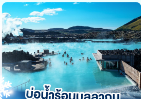
♻️ ❄️ แช่น้ำร้อนบลูลากูน

เก็บไอซ์แลนด์ แดนภูเขาไฟคิรูกูฟลา และ แช่น้ำร้อนบลูลากูน