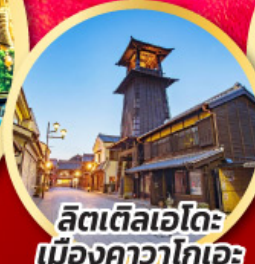
ลิตเติลเอโดะ เมืองคาวาโกเอะ