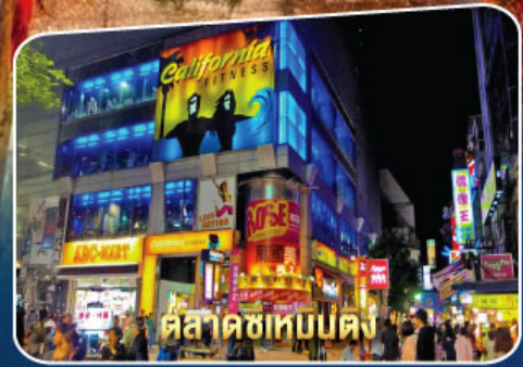
ตลาดซีเหมินตง