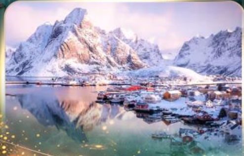
หมู่บ้านเรนเน