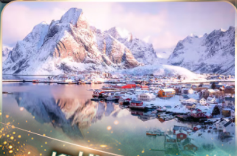
หมู่บ้านเรนเน

นอร์เวย์ แสงเหนือสุดฟิน เชคอินสุดว้าว 10 วัน 7 คืน