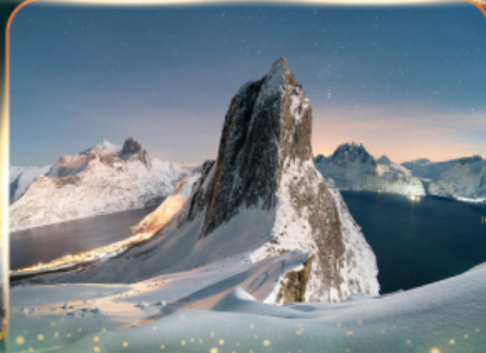
เกาะเซนญา