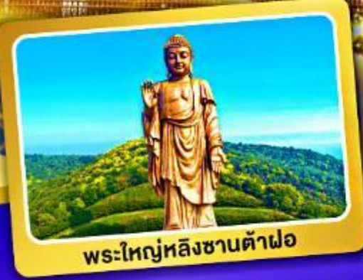
พระใหญ่หลังซานต้าฝอ