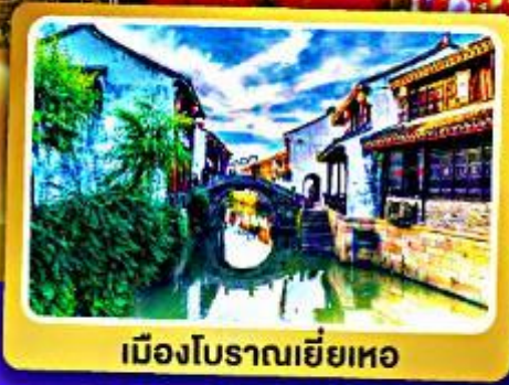
เมืองโบราณเหยี่ยวหอ