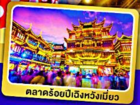
ตลาดร้อยปีเจิ้งหวังเมี่ยว