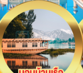
นอนบ้านเรือ วิวเขาหิมาลัย