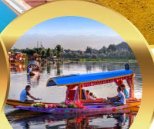
ล่องเรือซิคาร์่า