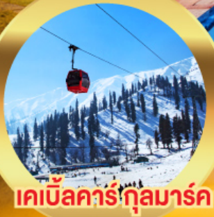
เคเบิลคาร์กุลมาร์ค