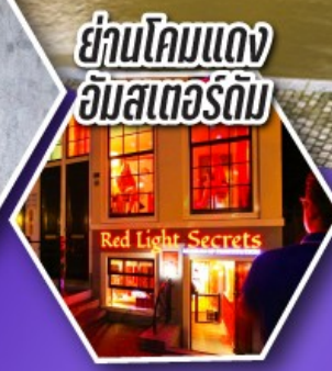
ย่านโคมแดง อัมสเตอร์ดัม